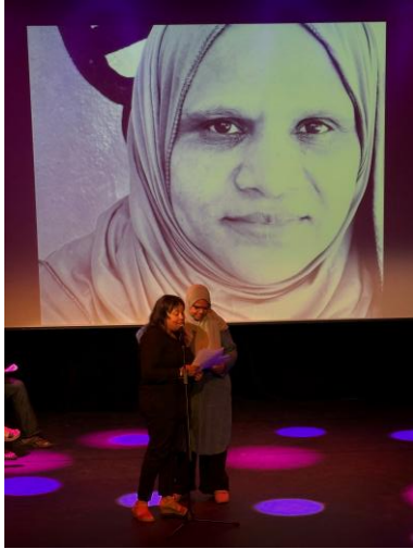
Collecte de portraits