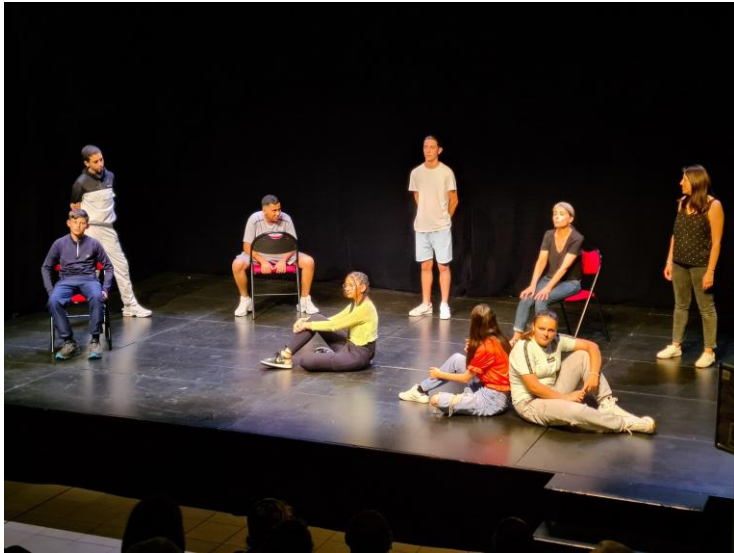
Trajectoires singulières (Spectacle avec des classes de Segpa)