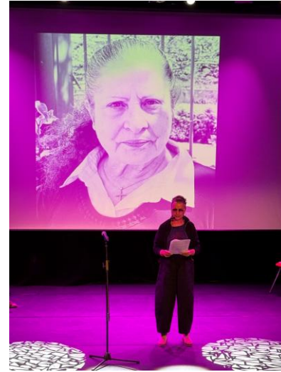
Restitution à sur la scène de la Passerelle