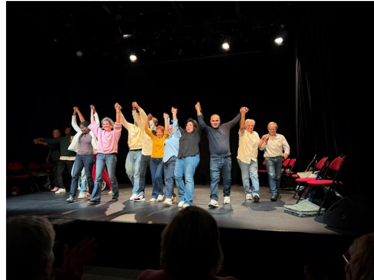
Projet théâtre avec POC