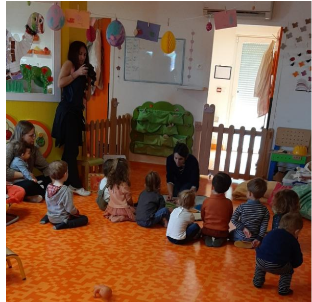
Printemps des petits