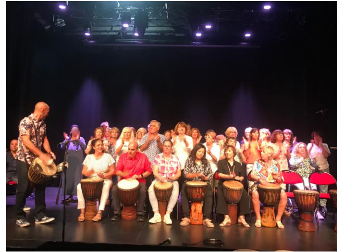
Cuisine moi une chanson