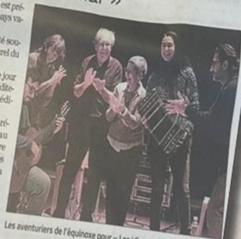
Les aventuriers de l'équinoxe pour « Los idiomas del mar ».