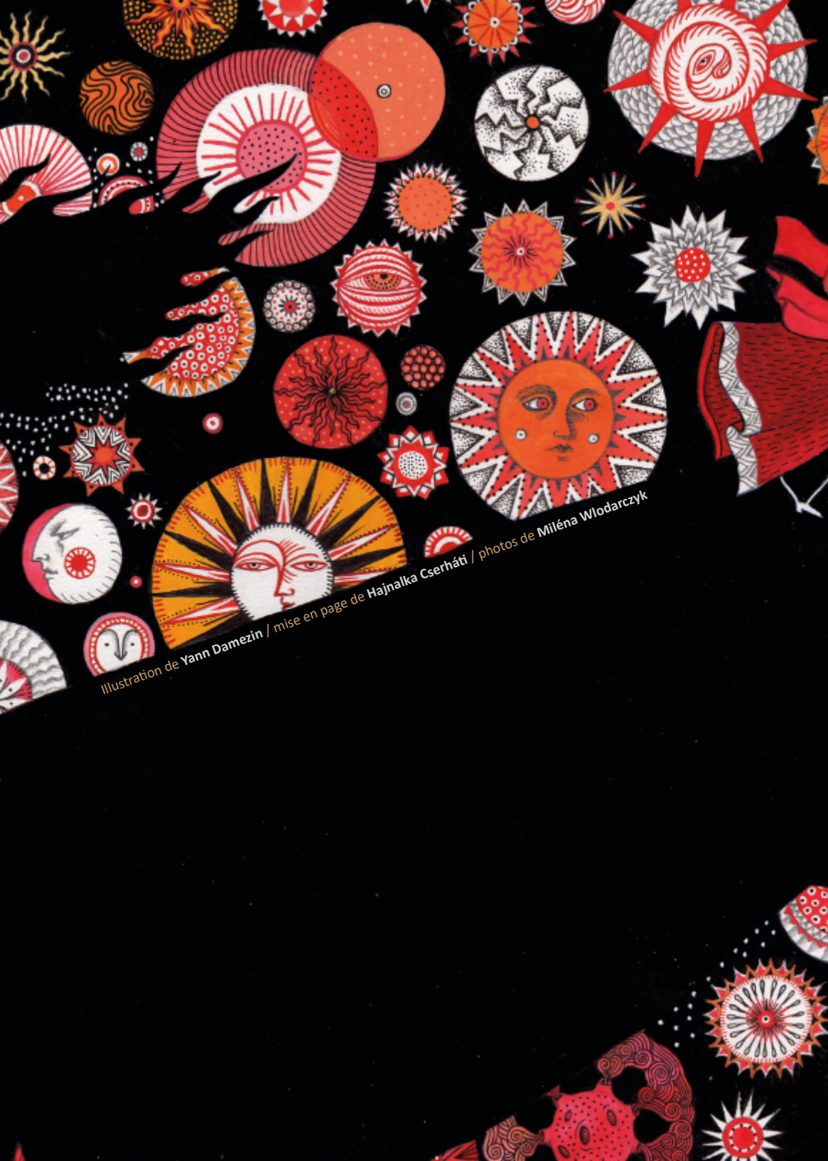
Illustration de Yann Damezin / mise en page de Hajnalka Cserháti