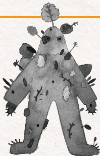
Illustrations: Hajnalka Cserhádi © Babouche à oreille