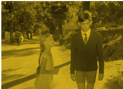
El camino