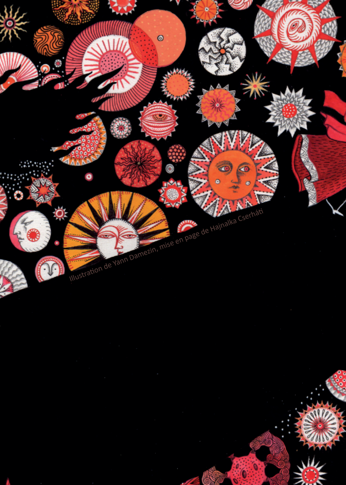
Illustration de Yann Damezin, mise en page de Hajnalka Cserhádi