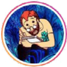
Illustration de couverture : Alfred

Cahiers (1931), Gallimard « Bibliothèque de la Pléiade »