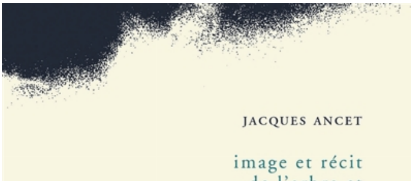
Image et récit de l'arbre et des saisons