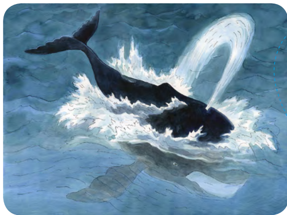
Le Marquis de la Bataine - éd. Gallimard

les éclats de lire et Occitanie Livre et Lecture vous donnent rendez-vous en décembre prochain pour un tout nouveau Coup d'éclat !