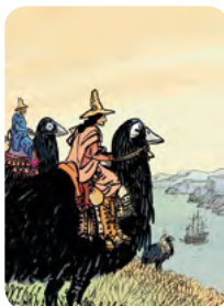
Les oiseaux ©François Place